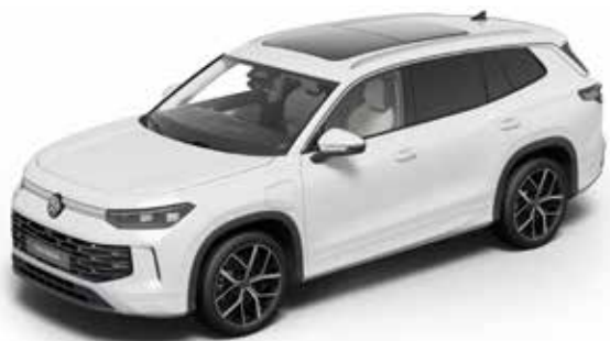
Pure White Uni-Lackierung