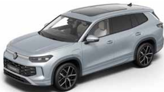
Oyster Silver Metallic-Lackierung