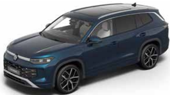
Nightshade Blue Metallic-Lackierung