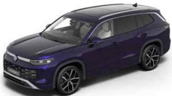
Ultra Violet Metallic-Lackierung